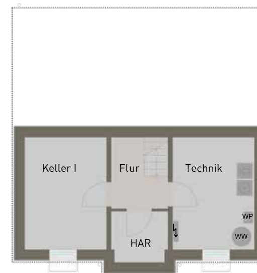
Untergeschoss (optional) Darstellung verkleinert